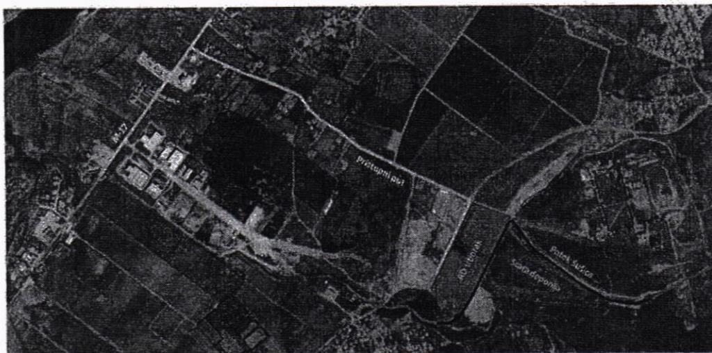
Slika 1 – Lokacija deponije

JP Deponija raspolaže ukupno sa cca 12 ha rezerviranog prostora za izgradnju, a postojeća Okolišna dozvola se odnosi na sve objekte na tom prostoru čija je namjena omogućiti pravilan rad pri sanitarnom odlaganju komunalnog otpada. U objekte spadaju i tijela deponije krutog komunalnog otpada koja trenutno, u ovoj fazi ukupne izgradnje, zauzimaju dvije površine za odlaganje otpada: prva površina od cca 2,1 ha (FAZA I) i druga od cca 0,85 ha prostora za odlaganje (FAZA II).